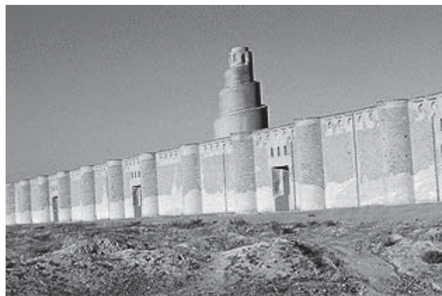
Große Moschee von Samara