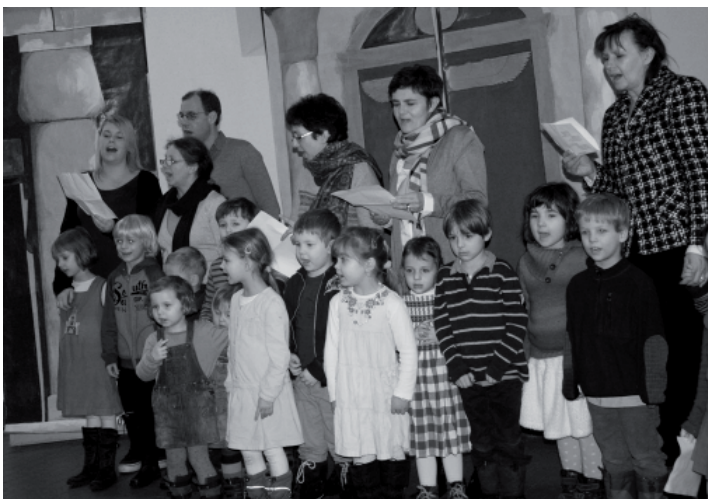
Kinder und ErzieherInnen der Kita Schlachtensee