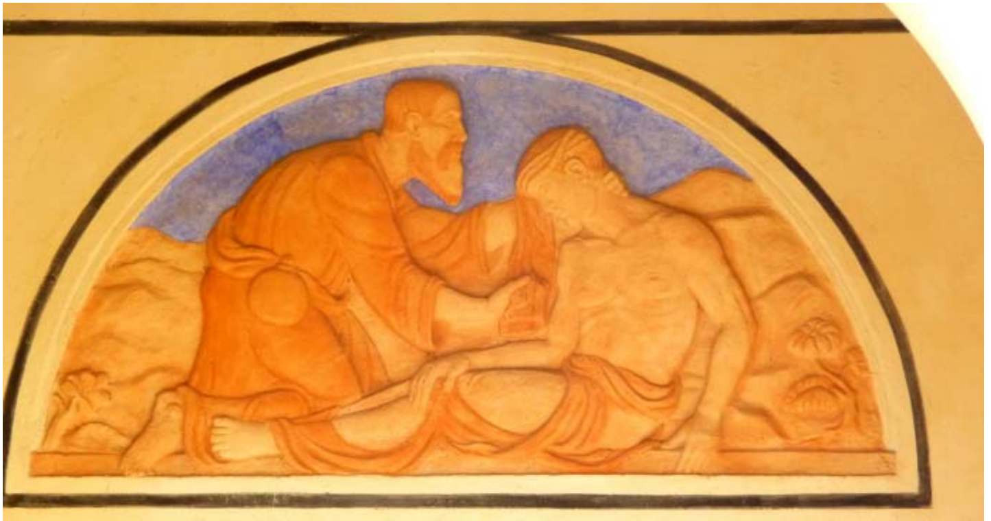
Relief über der linken Eingangstür der Johanneskirche (zum Artikel „Diakonisches Handeln und Mission in der Gemeinde“ auf S. 4)