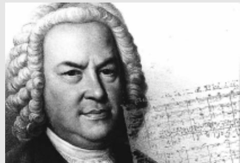
Johann Sebastian Bach